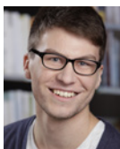
Jan Reisner Schweitzer Fachinformationen oHG