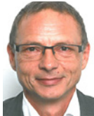
Dr. Thomas Krimmer Georg Thieme Verlag