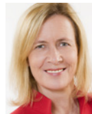
Felicia Ullrich u-form Testsysteme