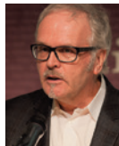
Erwin Miedtke Stadtbibliothek Bremen