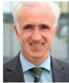
W. Arndt Bertelsmann W. Bertelsmann Verlag