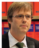
Rudolf Oechtering Boysen & Mauke - Schweitzer Fachinformationen, Hamburg